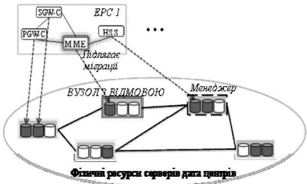
Рис. 1. Система з вузлом з відмовою

MN являє собою множину вузлів керування, де MN \subseteq N , які відповідають за функціонування пропонованого механізму відновлення після відмови. Кожен керуючий вузол пов'язаний з одним або декількома вузлами фізичної мережі і виконує кроки, необхідні для відновлення після відмови мережі (рис. 1). Процес призначення вузлів керування і критерії, які враховуються при виборі вузлів керування, досліджені у [16].